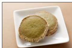
クッキー(精華町産ケール入り)