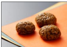
ボウロ(精華町産ケール入り)