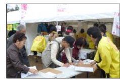
せいか祭り2015 試食アンケート調査