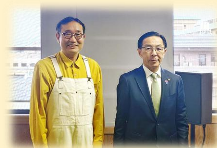
キックオフでご出演いただいた 西脇隆俊知事

協力 : 綾部市、井手町、伊根町、宇治市、宇治田原町、大山崎町、笠置町、亀岡市、木津川市、京田辺市、京丹後市、京丹波町、京都市、久御山町、城陽市、精華町、長岡京市、南丹市、福知山市、舞鶴市、南山城村、宮津市、向日市、八幡市、与謝野町、和束町